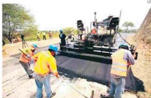
El JNE requerirá cerca de S/. 101 millones para afrontar elecciones.

Partidos fragmentados El secretario general de